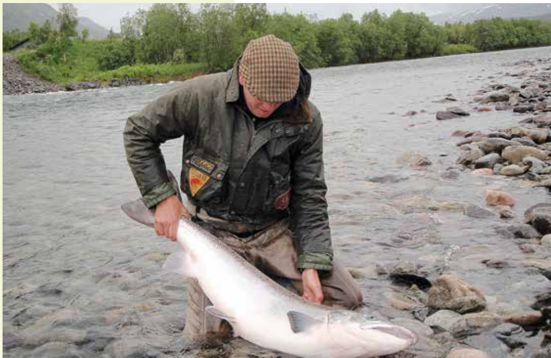
Jes! Taistelu on tällä kerralla voitettu.

”Paas tehden tilaa pakkaseen, nyt tulee läskiä kaapin täydeltä.”