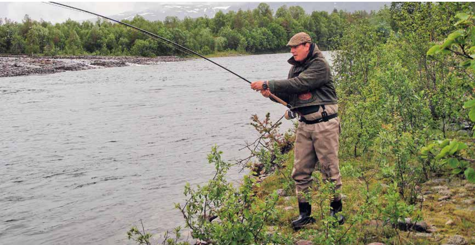
Kiinni on, mutta pysyykö?